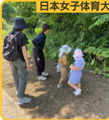
自然あそびゲーム