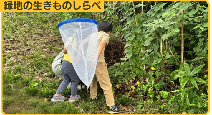
生きものの専門家に聞いてみよう