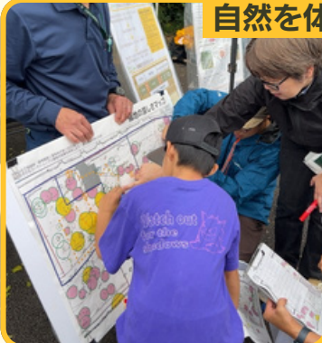
緑地の効果を調べよう