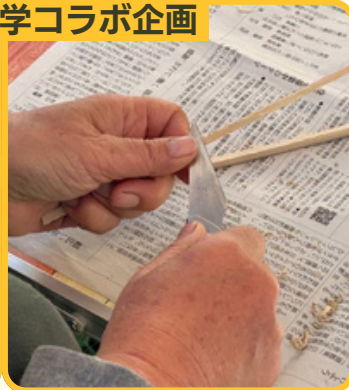
緑地の竹でマイ箸づくり