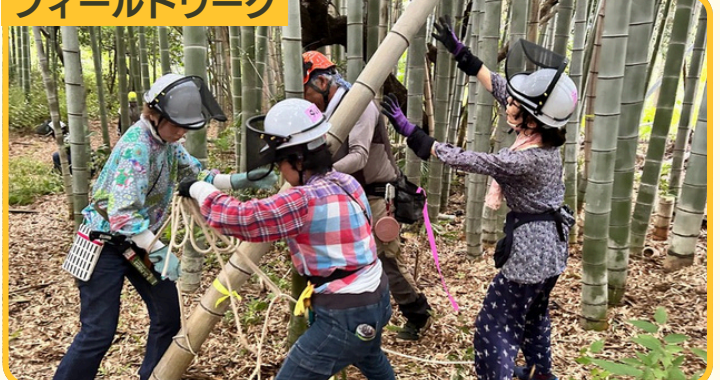
みんなで竹林を管理しよう

主催 世田谷区 みどり33推進担当部 問合せ先 公園整備利活用推進課 公園整備利活用推進担当 電話 03-6432-7911 FAX 03-6432-7989