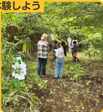
五感で楽しもう緑地 散策スタンプラリー